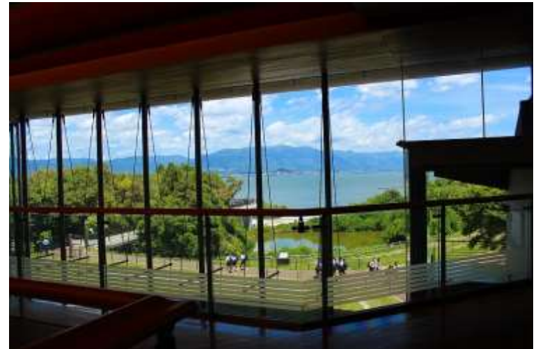
2020年にリニューアルした琵琶湖博物館「びわこのちから」を体感しました