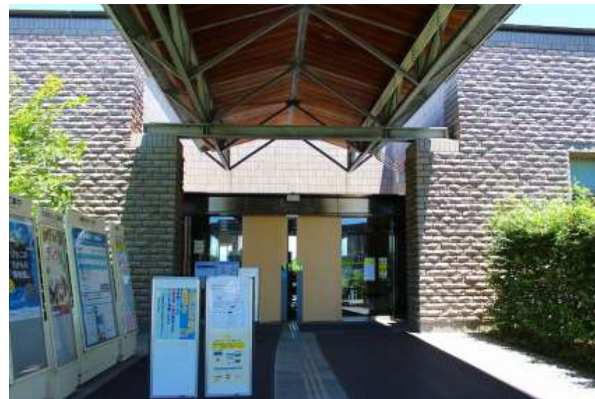
滋賀県立琵琶湖博物館