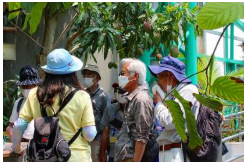
アトリウム（温室）にて植物の話を聞きました…夏はちと暑いです