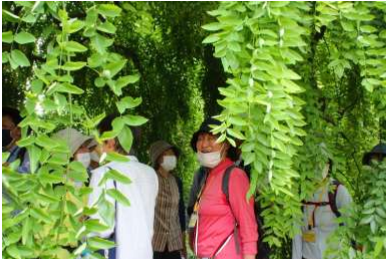
日陰を作る木（名前忘れました）