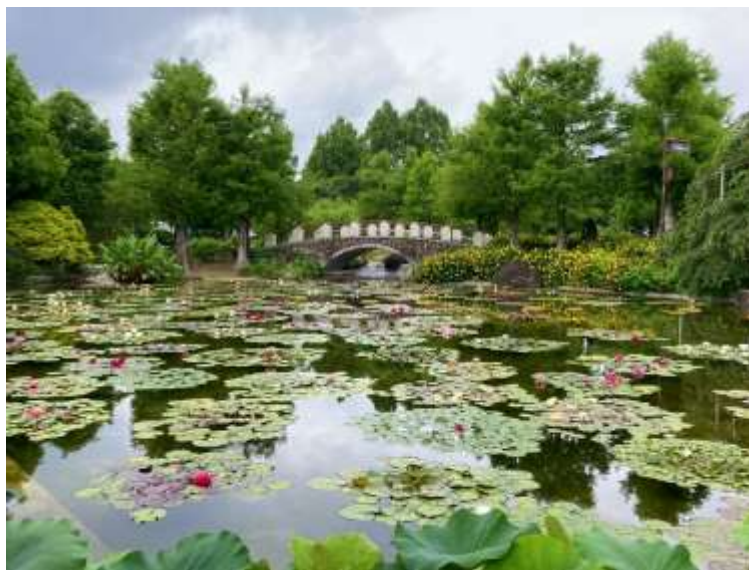
花影の池 (スイレン群生)