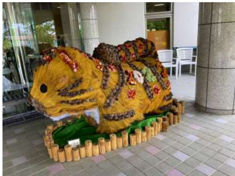
オブジェ (さて名前は?)