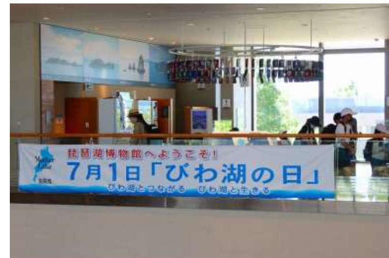
ゾウやリュウの展示物と「びわ湖の日」案内