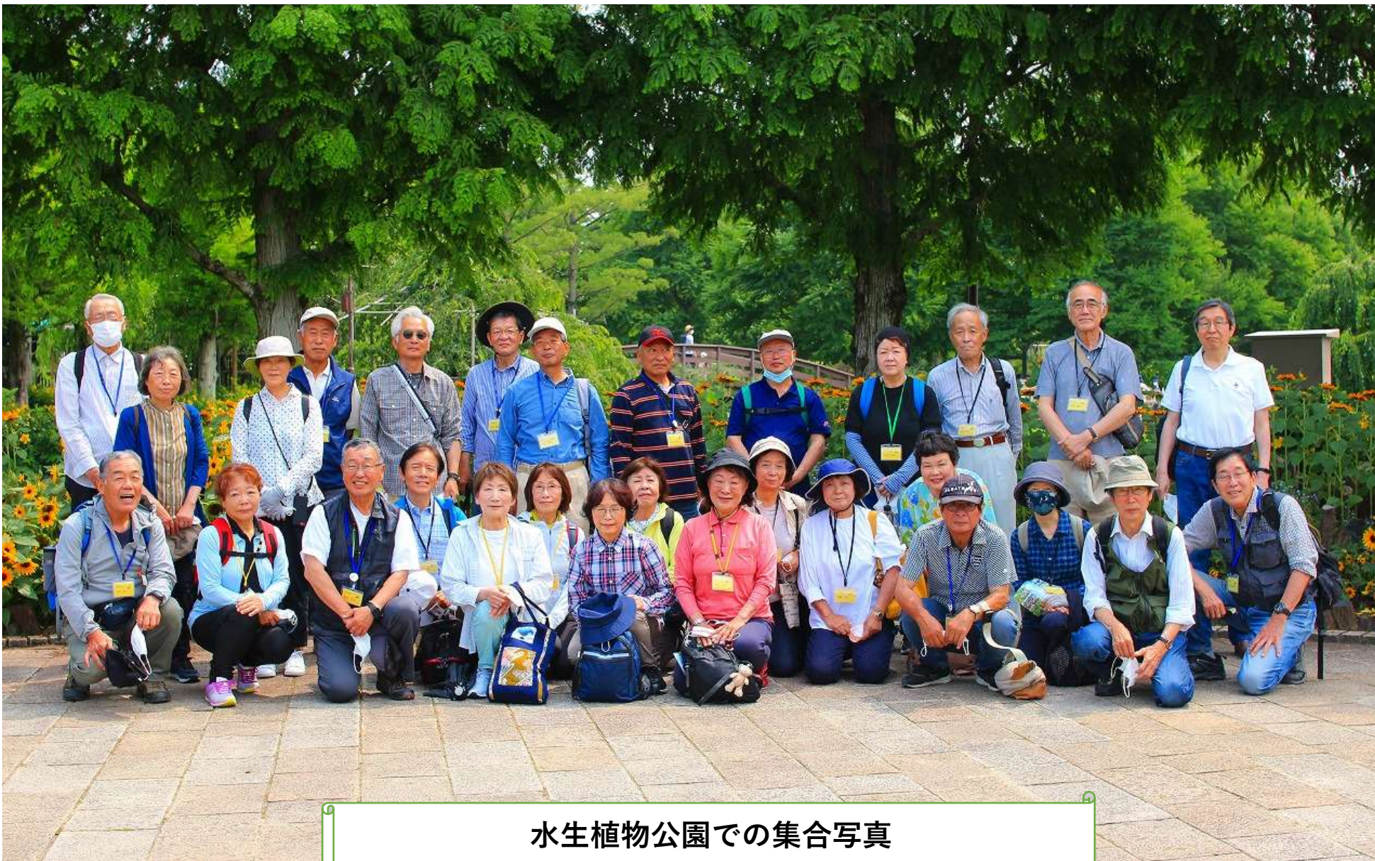
水生植物公園での集合写真