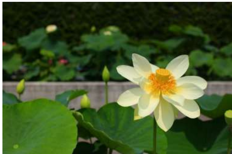
ハス・スイレンとの違いがわかりますか