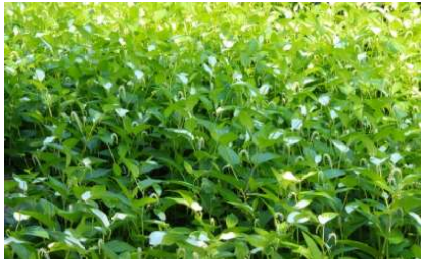
ハンゲショウ（半化粧）群生