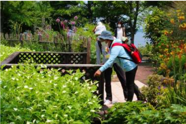
あれ、これ何だっけ??