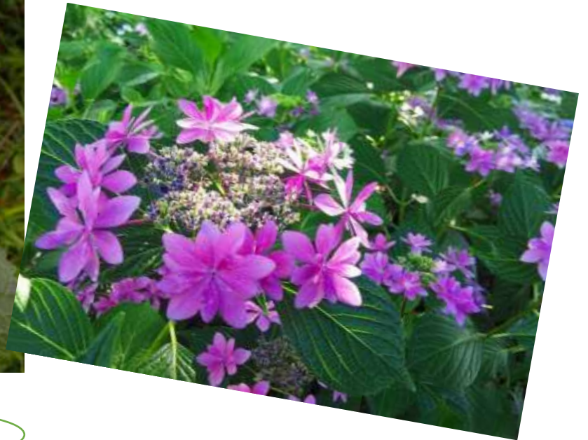
アジサイ園（梅雨時期の今が盛りです）