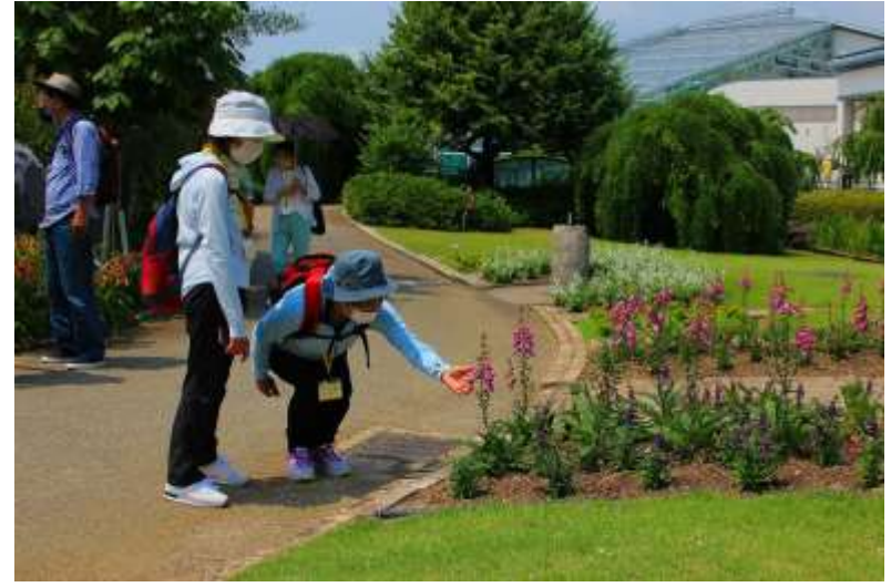
公園内の散策（今日は日陰ありがたい）