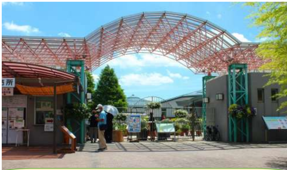
草津市立水生植物公園みずの森入口ゲート