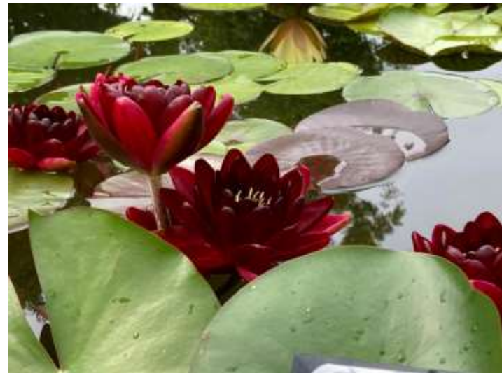
名前：ブラックプリンセス