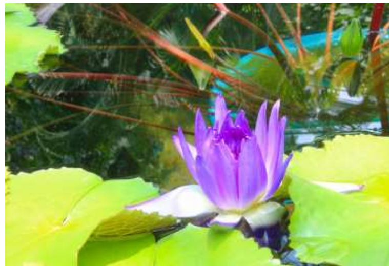
スイレン・ハスとの違いがわかりますか